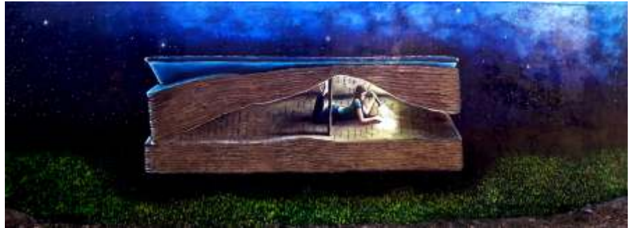
Mural Painting by Fine Arts Students

A little girl safely poised inside a book, sifting through the words with a torch in her hand in the backdrop of a distinct luminous starry night. The shiny blue colour immersed with bright lights and the whole microcosm of the little girl seems to be glittered by the sprouting rays out of the book. In this marvelous panorama of a mural portrayed on the back of the stairs of the Mola Bukhsh auditorium, the theme of enlightenment is transposed on the wall. This exquisite painting is emblematic of the UoS students' glorious propensity to creativity and stupendous artistic pursuits. The idea behind embellishing the walls of UoS with captivating paintings and murals is twofold: on the one hand it aims to cultivate a sense of connectedness with the alma